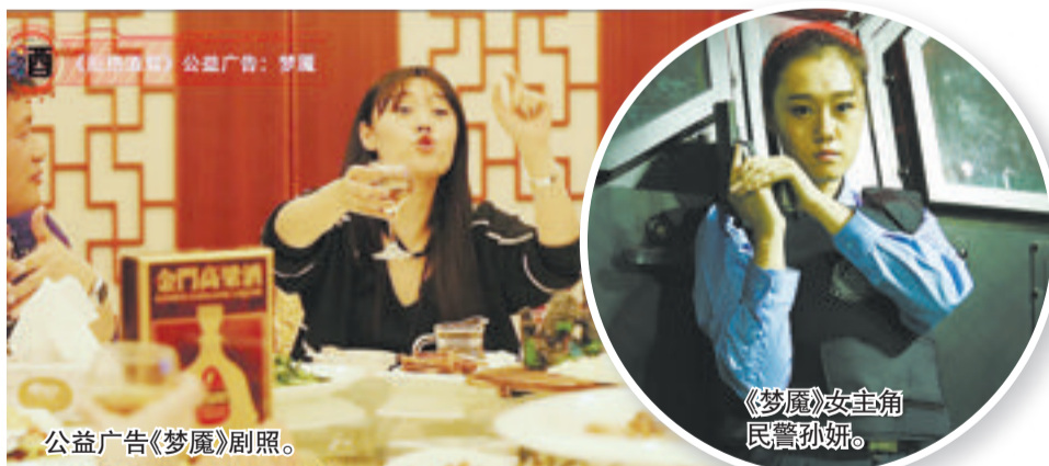
公益广告《梦魇》剧照。