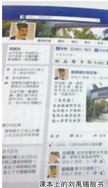
课本上的刘禹锡脸书。

本报讯 据台湾媒体报道,对一部分台湾初二学生来说,新学期的课本非常难忘。有台湾网友近日在网上晒新拿到的语文课本,竟引来意外关注。原来,课本上竟有唐朝诗人刘禹锡的脸书(台湾人常用的社交网站Facebook)页面!