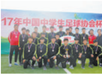
厦门二中高中足球队在全国比赛中再创佳绩。

本报讯(记者 路鸣宇)厦门二中中学生军再传捷报!历时10天的2017年中国中学生足球协会杯比赛,昨天在广西北海落幕,厦门二中高中足球队获得亚军,继2015年获得中国中学生足球锦标赛亚军后,再获全国中学生足球赛亚军。在初中组比赛中,厦门二中获得季军。