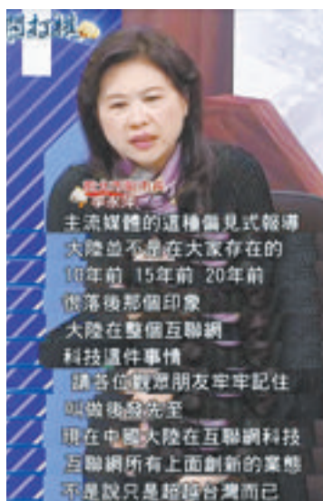
台湾电视政论节目截图。

李永萍认为,台湾当局应该承担责任,“民进党选择了一个最坏的时机与大陆对抗。特朗普当选美国总统后,台湾不知道要交