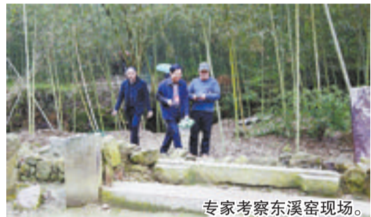
专家考察东溪窑现场。

本报漳州讯(文/图 特派记者 黄树金)昨日,记者从南靖县获悉,两天来国内外100多位专家学者走进“海丝”申遗点之一、漳州窑的代表——南靖东溪窑,深入探讨东溪窑的历史和学术价值,揭示其作为海上丝绸之路的重要史迹,以及在对外贸易史上的地位和贡献。20名专家学者还进行主题演讲。研讨会共收到论文52篇,其中国外的5篇,港澳台的8篇。去年,国家文物局把东溪窑遗址列为“海上丝绸之路·中国史迹”申遗名单。