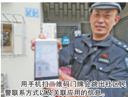
用手机扫二维码门牌会跳出社区居民联系方式以及关联应用的信息。

“狐尾山上的气象台,有部分建筑原本没有门牌号码,但又有管理人员住宿,这次将会新增‘气象台路’的二维码门牌,方便使用和管理。”民警举例说,一些老旧小区改造后更换新的地址,这次制作二维码门牌时也