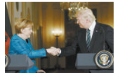
特朗普在白宫与默克尔握手。

据中新社电 据外电报道,近日,美国总统特朗普与德国总理默克尔在白宫进行首次会面,尽管特朗普在白宫迎接默克尔时,双方曾进行握手,但在联合发布会时,特朗普拒绝和默克尔握手。白宫发言人就此解释称:总统当时只是没听见。