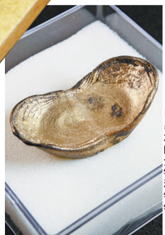
出水的金锭和银锭。