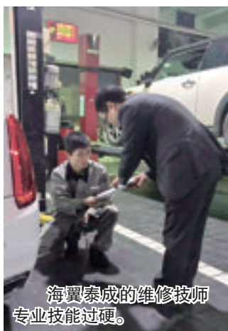
海翼泰成的维修技师专业技能过硬。