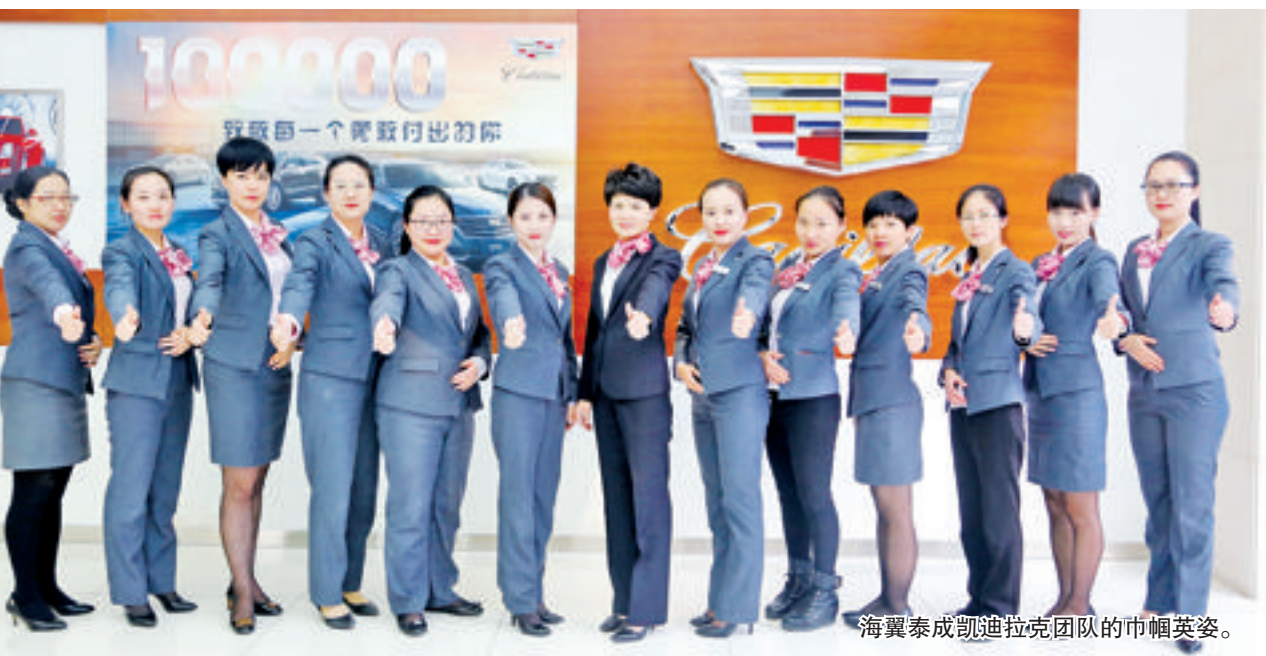
海翼泰成凯迪拉克团队的巾帼英姿。

2017年初,扎根厦门市多年的泰成汽车牵手海翼集团,成立厦门海翼泰成汽车服务有限公司,主营通用汽车旗下的凯迪拉克、别克、雪佛兰、荣威等品牌的销售和服务。依托国企,深耕上汽通用品牌,厦门海翼泰成汽车本着“客户第一,诚信至上”的原则,以崭新的面貌和风范,为厦门市民开启了全新的有车生活。