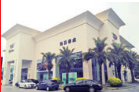
位于湖里大道的海翼泰成凯迪拉克4S店。

厦门市的凯迪拉克、别克、雪佛兰和荣威展厅集中位于湖里大道13号-28号路段,拥有超过2000平方米的超大销售展厅和2000平方米的售后综合维修中心,硬件配备豪华专业、工作团队热忱周到,一站式服务贴心周全。提供了整车销售、汽车维修、汽车装潢美容、汽车金融、汽车保险、二手车业务及新车挂牌等与汽车相关的所有服务。