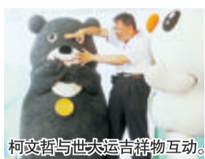
柯文哲与大熊猫吉祥物互动。

本报讯 据台湾媒体报道,因台北车站联合防务中心设置太慢,台北市长柯文哲15日扛上台当局,痛批“换了蔡当局也没比马当局好”,扬言要把台当局交通主管部门副负责人王國材“宰了”。王國材反批柯文哲不讲理,咬人也要咬对对象。