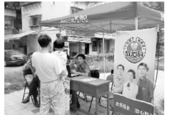
“红快”工程师正在瑞金花园为小区居民解答疑问。

的预言不好, 说我不适合早婚, 并且说我的名字带有二婚倾向。除了这个老师之外, 上次碰到的一个和尚也这样说我。我本来打算明年结婚, 可是听这么一说, 我真的很难为。哎, 难道我要为了这个推迟一年结婚吗? (值班记者 林萌萌)