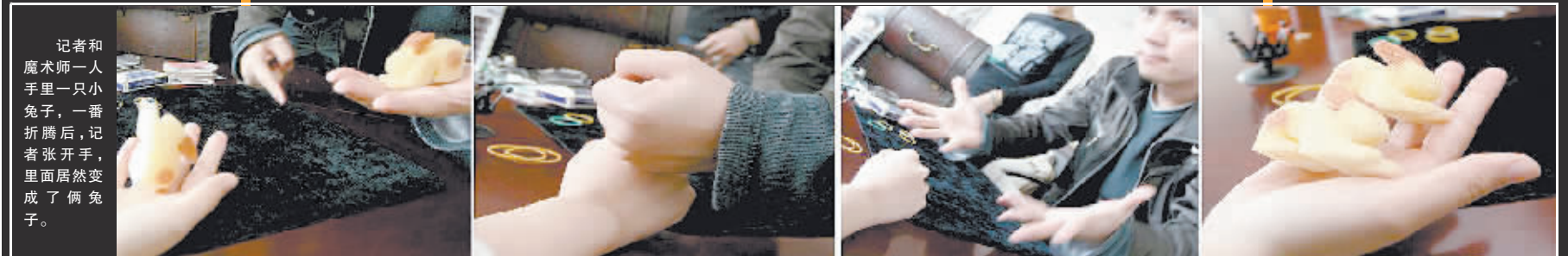
记者和魔术师一人手里一只小兔子,一番折腾后,记者张开手,里面居然变成了俩兔子。