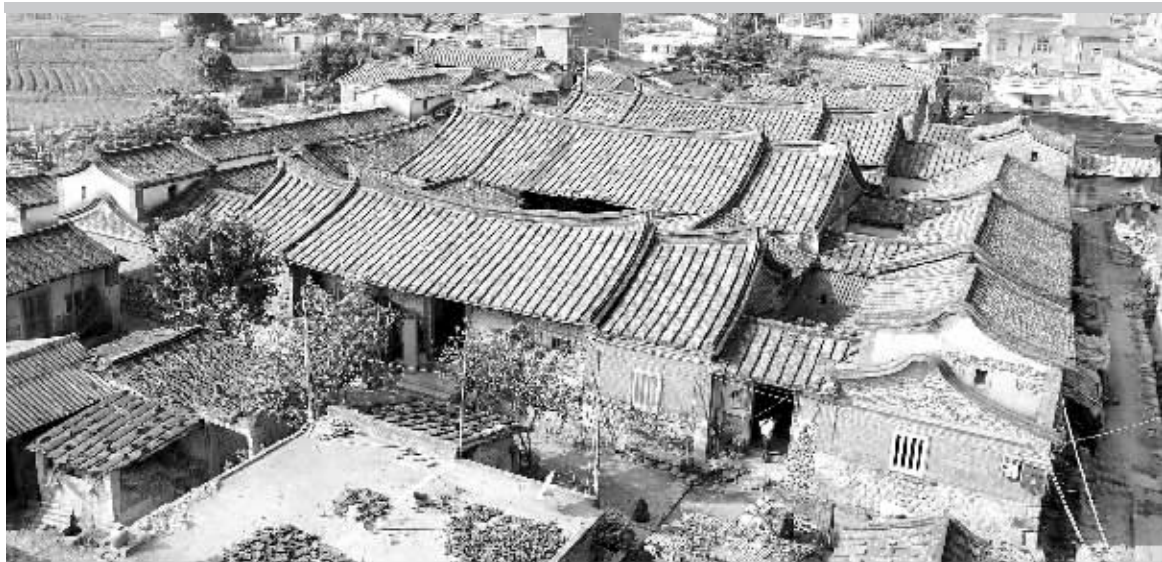
规模宏大的叶拱南故居。