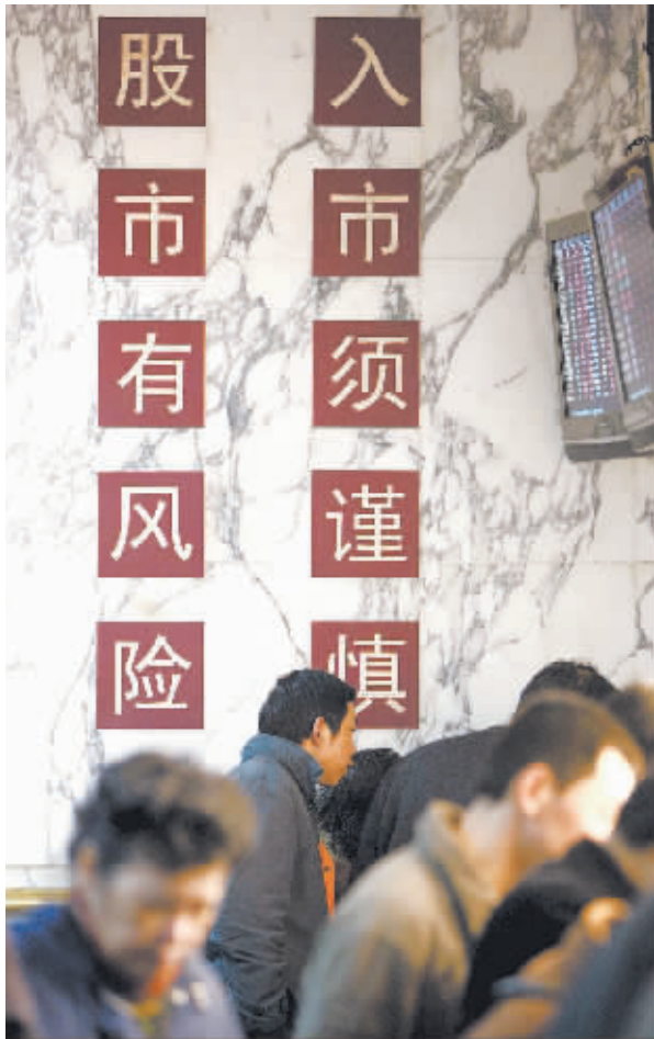
昨日,沪深股市双双暴跌,令投资者很迷茫。

蓝师傅找出了一系列数据来论证自己观点。他说,从股指下探1664点,一路曲折上涨至今,两市已有近百只股票重回6000点之上,中兵光电就是例证。连一向“蜗牛”的封闭式基金都走出了不错的行情,此前基金安顺和基金丰和两只封基的市价(复权后)已经成功重回6000点。翻倍、涨50%的个股比比皆是。还有一些股票等待补涨呢。