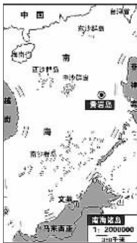
南海海域部分岛屿地理位置图。