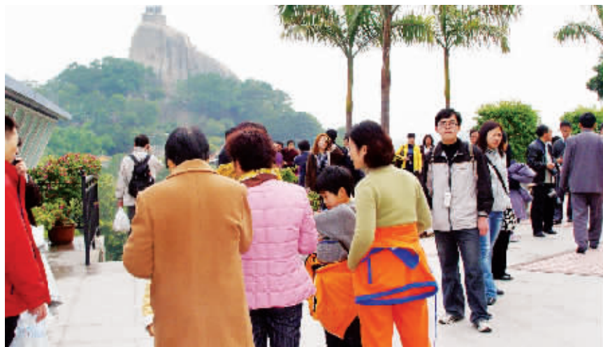
旅行社准入门槛降低,意味着“服务”将更加重要。王火炎 摄

但显然,作为监管部门的厦门市旅游局来得更为谨慎。旅游局相关负责人在接受记者采访时说,从2007年《中国公民出境旅游合同》正式使用开始,厦门就已经开始根据这些内容对旅行社的服务进行监管。“新《条例》将会