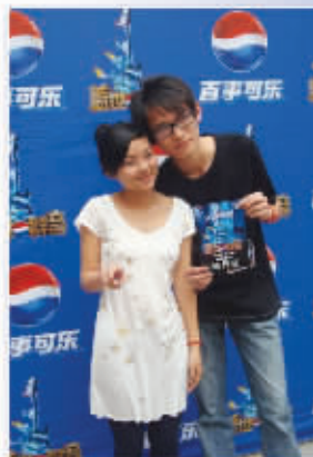
来自福州大学的“乐扣乐扣”组合

海选福州省 九地市全面铺开, 参赛选手惊喜不断 赛事组委会称, 面对全省其他城市选手热情高涨的参赛情绪, “盖世群音”海选赛程也将立即覆盖九地市, 满足各城市参赛朋友的要求, “盖世群音”全省赛事已全面打响! 结盟商家“和声钢琴”和“AGOGO自助KTV”, 为晋级选手都精心准备了礼品, 是爱唱歌的朋友们的最好奖励! 而在以后的各级比赛中, 丰厚的现金及乐器大礼更是数不胜数!