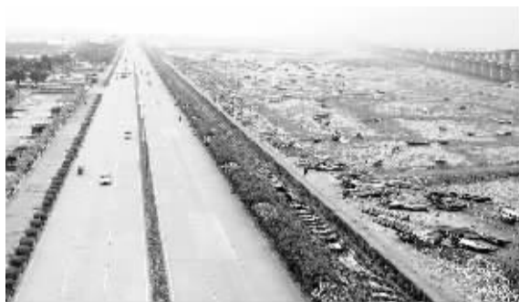
俯瞰集杏海堤。P0612091

另一方面,我市基础设施建设不断加强,相继完成了厦门大桥、海沧大桥、集美大桥、杏林大桥、翔安隧道的建设,使得海堤的交通功能得到了缓解;在杏林大桥建