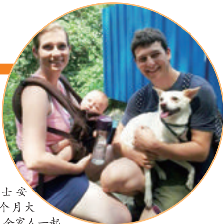
■ 士安四个月大时,全家人一起陪菜花回阿福流浪动物之家打疫苗。