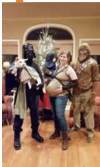
■ 全家玩角色扮演《星球大战》,菜花也一身角色服装。

厦门流浪狗菜花的“狗生”非同寻常。三年来,从中国到美国,它完美陪伴了一弟两妹从一颗小胚胎到可爱生命成长。现在,远在美国田纳西州的一座温馨屋子里,菜花不亦乐乎地忙碌在三岁弟弟以及双胞胎妹妹的身边。